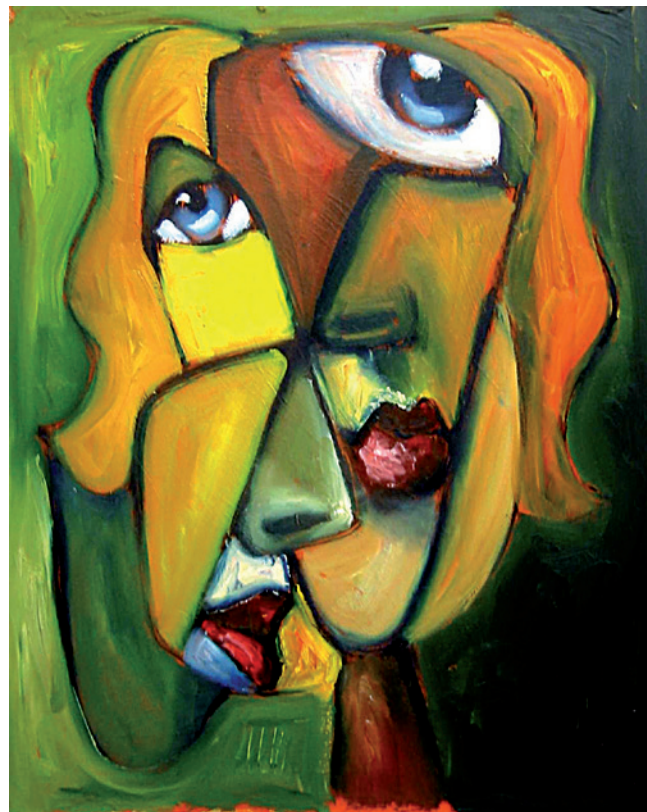
Titelbild: Karlheinz van Vügt