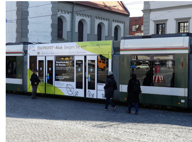
Zum 20-jährigen Jubiläum des ÖKOPROFIT®-Klubs im Jahr 2021 wurde eine Straßenbahn gestaltet.

Im Jahr 2001 startete ÖKOPROFIT® Augsburg mit dem Ziel, Betriebe wirtschaftlich zu stärken und gleichzeitig die Umweltsituation zu verbessern. Seitdem haben bereits 83 Betriebe aus der Region teilgenommen, viele Unternehmen über den ÖKOPROFIT®-Klub sogar mehrfach. Dank des Umweltmanagementsystems konnten in diesen 20 Jahren eine große Menge an Strom, CO 2 , Wärme, Kraftstoff und Kosten eingespart werden.